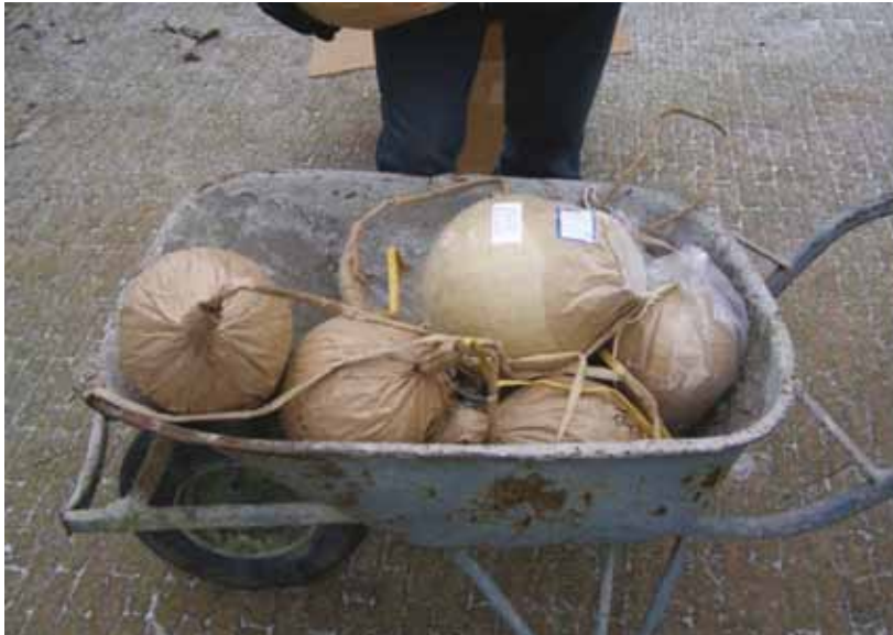
Het vervoer van zeer explosief vuurwerk, zoals mortierbommen, is levensgevaarlijk voor scheepsbemanning.

werk op last van de Duitse rechter teruggestuurd naar China.” Het illegale vuurwerk komt voor een groot deel uit dat land. Rederijen vervoeren het in opdracht van veelal Nederlandse importeurs naar Europa. Vanwege het strenge toezicht in Rotterdam wijken de schepen uit naar Hamburg en Antwerpen. Van daaruit gaat het vuurwerk naar opslagplaatsen in Duitsland, veelal voormalige munitieopslagbunkers van de NAVO. Vervolgens wordt het in kleine porties naar handelaren in Nederland vervoerd. VROM-IOD richt zich op Nederlandse importeurs en handelaren, maar werkt voor een sluitende aanpak internationaal samen. Met Duitsland, België en China, maar ook met de rederijen. „We zijn met een aantal reders in gesprek en hebben presentaties gehouden. Het probleem is dat het voor hen economisch niet haalbaar is om alles te controleren. Toch willen ook zij meewerken aan een internationale aanpak. Zwaar massa-explosief vuurwerk is een levensgroot gevaar voor de bemanning en de schepen.”